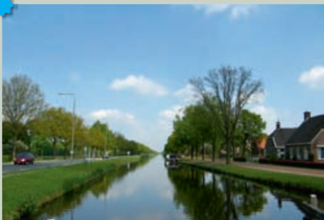
De Drentsche Hoofdvaart

We starten in Assen, de hoofdstad van Drenthe. Het centrum van Assen is rijk aan historische gebouwen: wie op de Brink staat kan bijna het kloostercomplex nog zien waar de stad haar bestaan aan te danken heeft. Vervolgens rijden we over de N371 naar het zuiden langs de Drentsche Hoofdvaart (24), en