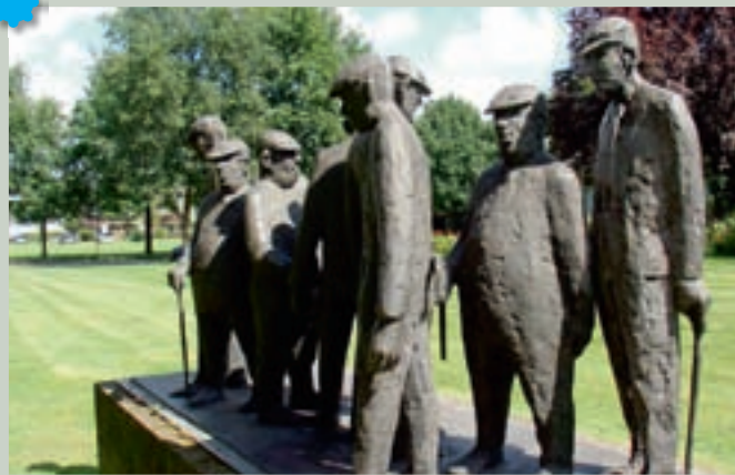
Beeldengroep "De markt" aan de Grolloërstraat te Rolde