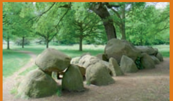
Hunebed te Rolde

In Rolde staat in een sfeervolle, oorspronkelijke omgeving de St. Jacobskerk uit de vijftiende eeuw. Wie langs het erachter gelegen kerkhof loopt treft twee grote hunebedden aan. Pal daarachter ligt een verhoogd pad: hier reed tot 1971 de trein Assen-Stadskanaal. Het oorspronkelijke station is bewaard gebleven (Balloërstraat). Kortom: vijfduizend jaar geschiedenis binnen tweehonderd meter!