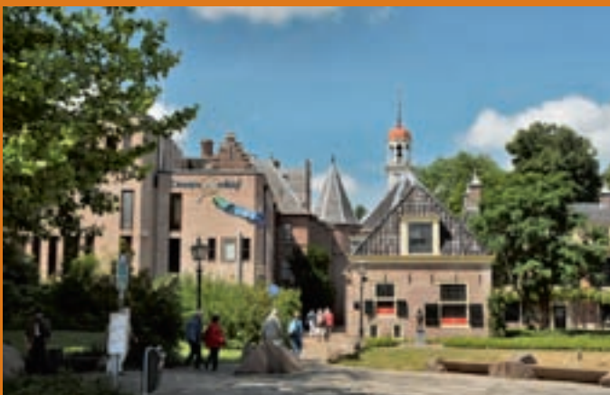
Drents Archief te Assen

Een bezoek aan Assen begint natuurlijk bij het Drents Museum (Brink). Daarnaast ligt het Drents Archief, dé plek voor wie zich bezig houdt met de geschiedenis van Drenthe. Een deel van de kloostergang van het oorspronkelijke klooster is daar bewaard gebleven. Een aanrader voor wie geïnteresseerd is in militaire geschiedenis is het Stoottroepenmuseum (kazerne, Balkenweg).