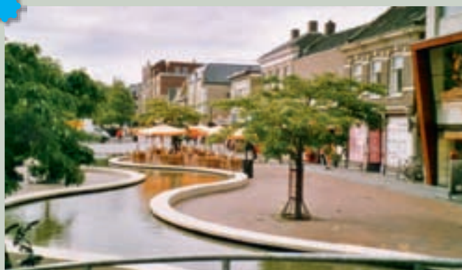
Hoofdstraat in Hogeveen

Nu rijden we naar Hogeveen (30), al lang een centrum van bedrijvigheid: zo was het in de achttiende eeuw de grootste turfproducent van het land. Na een kort stuk over de snelweg