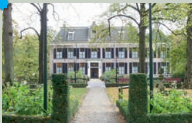
Het Huis te Echten

Weer terug bij Dieverbrug steken we de Hoofdvaart over en komen via de N855 aan in Dwingeloo (48). Dan voert een landelijke weg naar Ruinen en Echten, waar het Huis te Echten zeker een bezoek waard is.