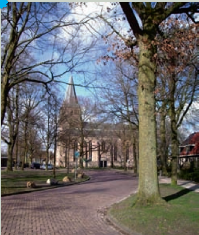
De Brink te Diever

passeren de oude vervingdorpjes Smilde en Hoogersmilde (18). Bij Dieverbrug, vlak na de oude kalkovens langs de kant van de weg, slaan we rechtsaf en bezoeken Diever (7), landelijk bekend van de Shakespeare-opvoeringen die daar jaarlijks in de open lucht worden gehouden.